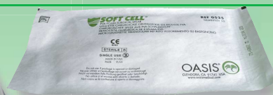
(1パック:5本入り袋 x 2)